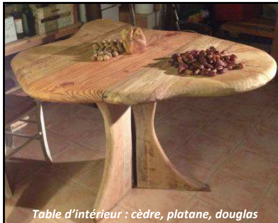
Table d'intérieur : cèdre, platane, douglas

Au Pas de l'Arbre cherche à travailler sur un marché parallèle à celui des scieries industrielles. Cette complémentarité permet de valoriser au mieux l'ensemble des bois de nos forêts. En proposant des réalisations originales et sur mesure , l'entreprise peut mieux valoriser le bois et se démarquer auprès des consommateurs.