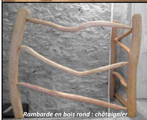
Rambarde en bois rond : châtaignier