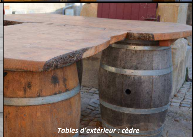
Tables d'extérieur : cèdre

Aujourd'hui, il est nécessaire d'améliorer nos conditions de réalisation de ces produits finis. Le vent, le froid, la boue, la poussière, nous obligent à effectuer les finitions dans la cuisine ! Lors de la conception du hangar de 800 m 2 , une place a été prévue pour un atelier de travail du bois (surface de 200 m 2 avec un étage de 100 m 2 ). Il nous permettra de travailler dans de meilleures conditions et d'accueillir auto-constructeurs, paysans, entrepreneurs souhaitant réaliser eux-mêmes leurs projets.